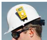
Attacco per elmetto