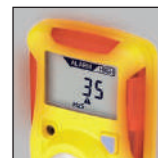
Facile da individuare