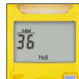
Di facile lettura