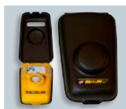
Alloggiamento per ibernazione