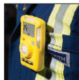
Facile da indossare